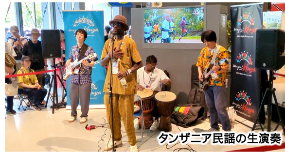
タンザニア民謡の生演奏

万博会場には様々な飲食・物販施設があります。開幕当初、入場者の口コミでは「何もかも高い」という声がありました…では実際どうだったのか。答えは「物や店舗による」。本当に価格帯はピンからキリまで広いです。筆者は「好きやねん大阪フードコート」でお好み焼きを食べましたが、お好み焼きは1200円前後でした。またフードコート内の他の店舗も、定食や麺類など、概ね1000円台というところでした。一方で高いのはパビリオンに併設された飲食店。例えば、イタリア館のレストランではパスタが2000円台後半、ピザが3000円前後です。また、フランス館は本格的なコース料理の提供が行われており、7000円台から15000円台と、財布もびっくりなお値段です。また、物販施設は各所に設けられています。お土産にピッタリなお菓子類は1000~2000円程度のもが多く、それほど駅や空港の売店とほとんど変わりありません。しかし、マクドナルクのぬいぐるみなど、万博ノベルティは高価格帯が多く、売店で見かけた小サイズでも4400円。これから出かける方がいるならば、飲食も物販も事前にリサーチしてからのお出かけをオススメします。