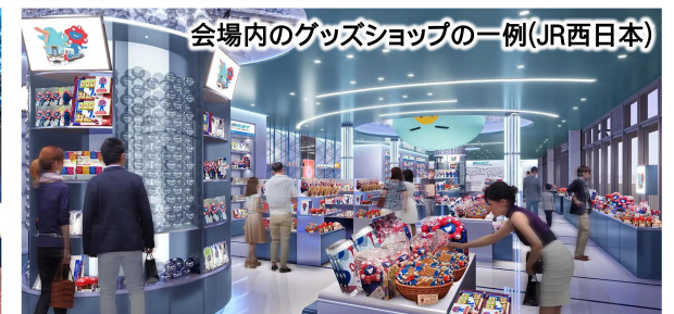
会場内のグッズショップの一例(JR西日本)