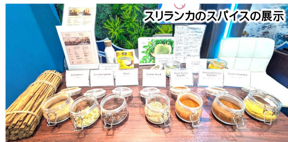
スリランカのスパイスの展示