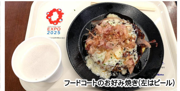
フードコートのお好み焼き(左はビール)