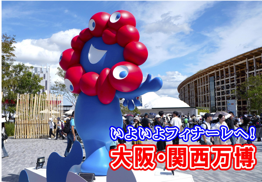
いよいよファイナルへ！ 大阪・関西万博

4月にスタートした「大阪・関西万博」も、いよいよ10月13日の閉幕が迫ってきました。弊社でも社内研修の一環として、営業チームによる現地見学を実施しました。閉幕まであと1ヶ月を切った現地の状況の特集します。